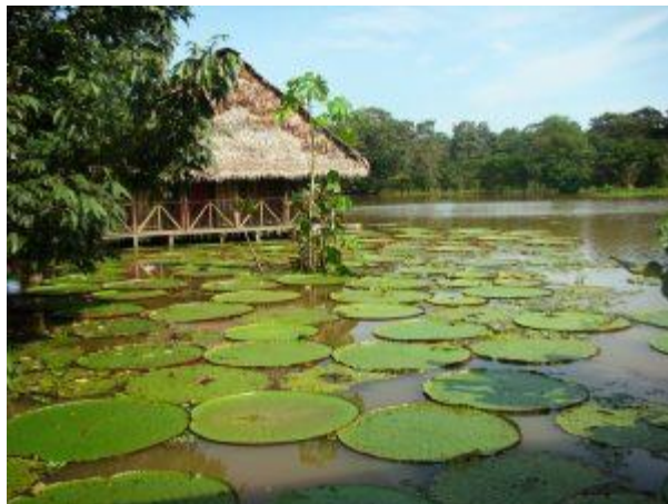
Victoria Regia: la flor de loto más grande del mundo